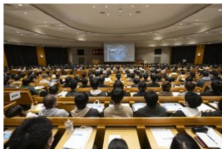
基調講演（フロム・ソフトウェア）